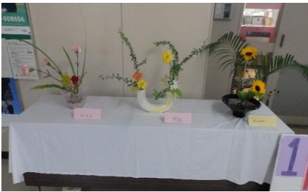
華道部の作品展示