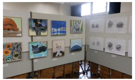
美術部の作品展示