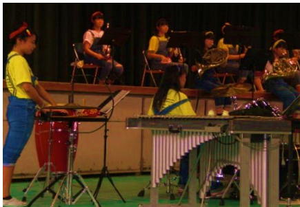
吹奏楽部のステージ発表