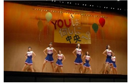
ダンス部の華麗な演技