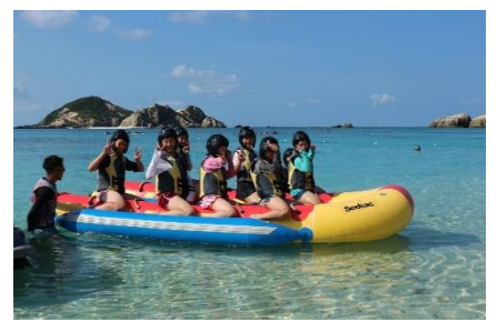
沖縄の海はマリンドブルー