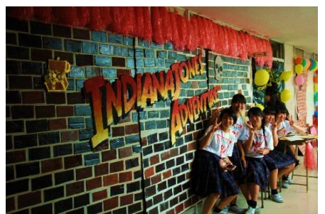
展示場の装飾にも工夫