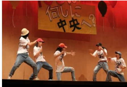
開催式での有志のパフォーマンス