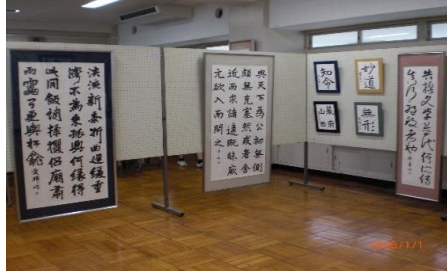
書道部の作品展示