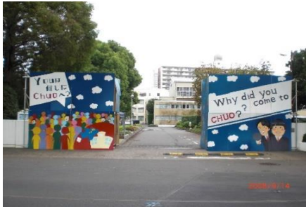
正門も文化祭デコ

両日ともたくさんのお客様（2,755名）にご来校いただきました。誠にありがとうございました。文化祭実行委員と生徒会本部役員が中心になり、夏休み中から準備を進めてきました。文化部は日頃の活動の成果を発表し、クラスや各参加団体では、生徒の工夫と団結で多くの皆様に楽しんで頂けるように努めました。