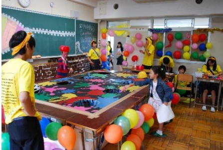
来校者を楽しませるアトラクション