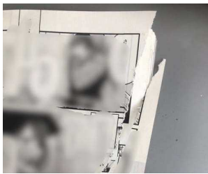
↑先月入ったばかりのコミックスが破けていたのを図書委員さんが見つけた

見つけた時は、本は棚に戻さずそのまま司書に教えてください。 ⇒和紙や糊で修繕します！